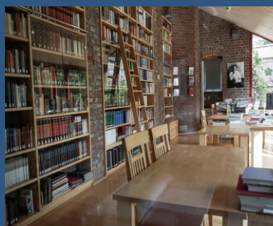
Edith-Stein-Archiv zu Köln Bilderrecht: Lucrezia Zanardi

Copyright: Edith Stein Netzwerk Köln-Bonn und Edith-Stein-Archiv zu Köln