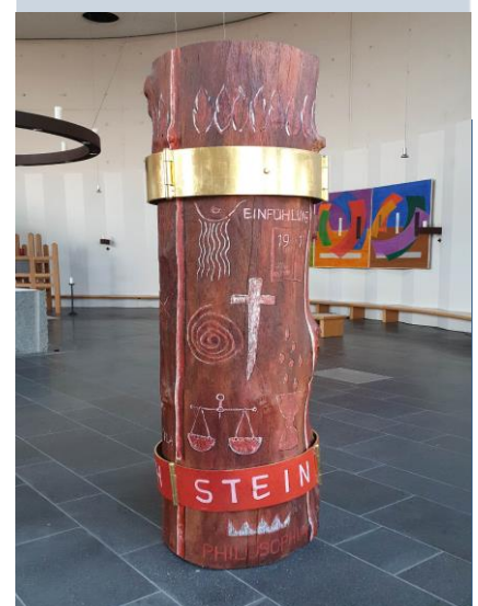
Edith-Stein-Stele Kirche St. Edith Stein